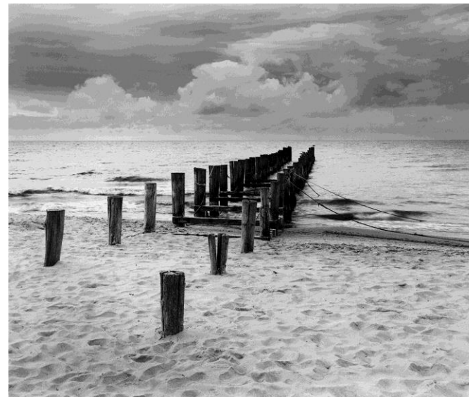
Alter Anleger - Zingst -