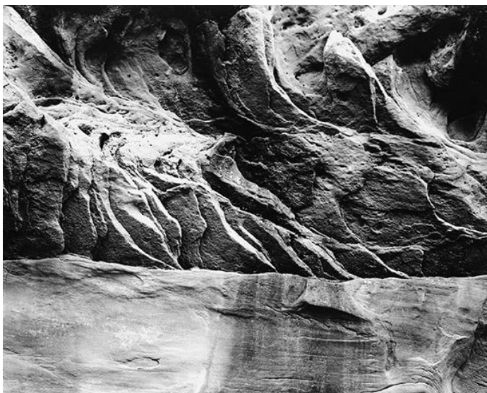
o.T. - Little Death Hollow, Utah (USA) -